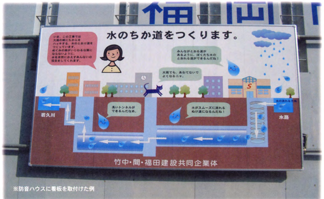
※防音ハウスに看板を取付けた例

取付場所、ご予算、絵柄・文字・写真等の内容に応じて、 もっともふさわしい素材・形状・描画を ご提案させていただきます。